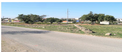
Les Paretetes dels Moros

La villa romana de Les Paretetes dels Moros se encuentra dentro de la partida del Bordellet del término municipal de Moncada, a unos 100 del casco urbano y a unos 9.000 m al NO de la ciudad de Valencia. Se instala sobre un promontorio de aproximadamente a 40 m.s.n.m. plantado en la actualidad de algarrobos y almendros a escasos metros de la margen derecha del barranco de Carraixet.